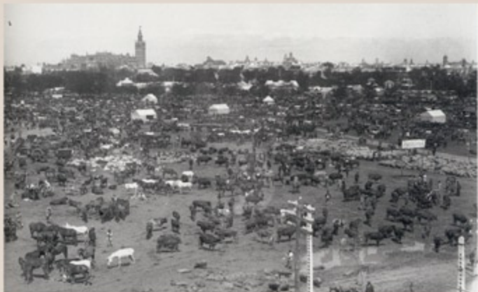
Recinto ferial en 1915