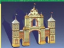
Portada Feria 2004