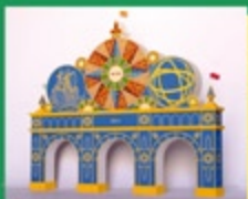
Portada Feria 2011

Proyecto y Dirección Técnica: Servicios Técnicos de Fiestas Mayores.