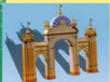
Portada Feria 2006