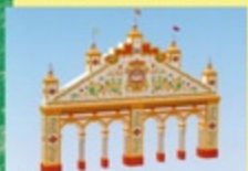
Portada Feria 2009