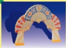
Portada Feria 2005