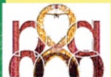
Portada Feria 2010