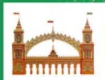
Portada Feria 1992